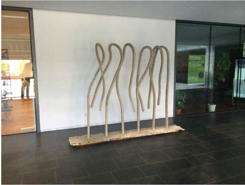
Ruedi Arnold „Kolonne“ Eisen und Papiermaché 2006